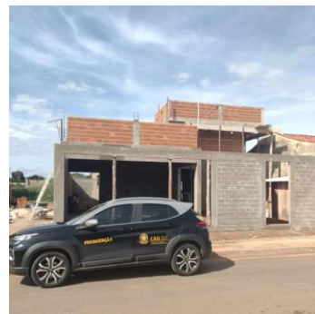
Cáceres 05 a 07/05