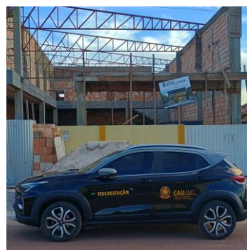
Peixoto de Azevedo 26/05