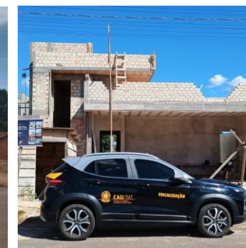
Guarantã do Norte 29 a 30/05