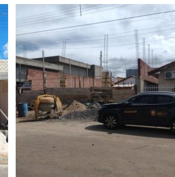
São José dos Quatro Marcos 29 e 30/05