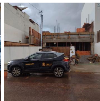
Mirassol D'Oeste 27 e 28/05