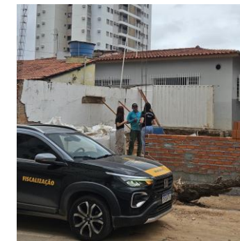
Cuiabá 19 a 23/05