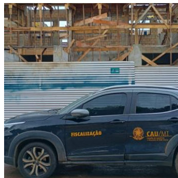
Colíder 05 e 06/05