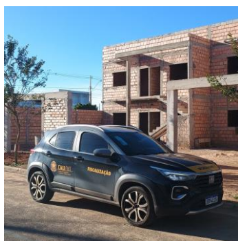
Primavera do Leste 19 a 23/06