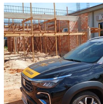
Matupá 27 e 28/05